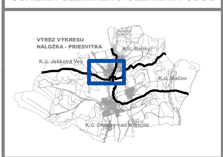
SCHÉMA ÚZEMNÉHO ČLENENIA OBCE