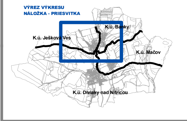
SCHÉMA ÚZEMNÉHO ČLENENIA OBCE

PERSPEKTÍVNE POUŽITIE POĽNOHOSPODÁRSKEHO PÔDNEHO FONDU A LESNÉHO PÔDNEHO FONDU NA NEPOĽNOHOSPODÁRSKE ÚČELY