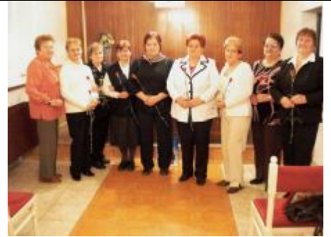
Jubilanti – členovia Jednoty Diviaky n/N