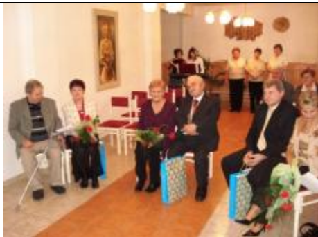
Dva strieborné, jeden zlatý manželský pár