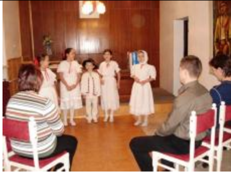
Deti z DFS Studnička

V rámci tematickej výstavy k Vianociam, ktorá sa konala v KD v Diviakoch nad Nitricou v prvý decembrový týždeň, ZPOZ Človek človeku pripravil stretnutia s jubilujúcimi manželskými pármí, s darcami krvi a jubilantmi – členmi DV COOP Jednota Diviaky nad Nitricou. Do obradnej siene prijalo pozvanie aj 11 manželských párov so svojimi deťmi – novými občiankami našej obce. Všetky podujatia boli plné srdečnosti, úprimnosti. ZPOZ ďakuje Územnému spolku SČK v Prievidzi a DV COOP Jednota Diviaky nad Nitricou, ktorí iniciovali poďakovanie darcom krvi a jubilantom – členom DV Jednota.