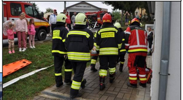
Taktické cvičenie v Nitrianskych Sučanoch.

Dobrovoľný hasičský zbor v našej obci je založený niekoľko desaťročí. Pomáha vďaka