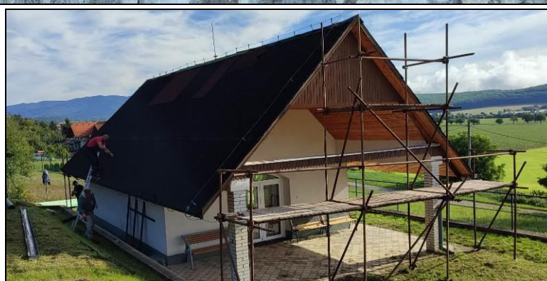
Rekonštrukcia strechy na Dome smútku v Somorovej Vsi.