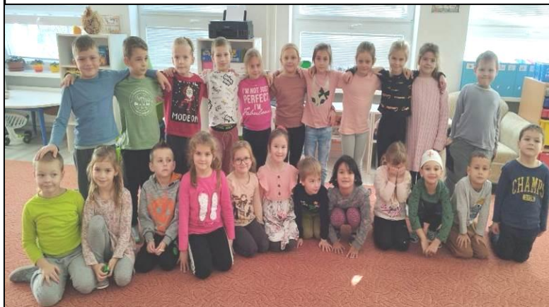
Radostné stretnutie predškolákov a prvákov.

Rodičovské združenie pri Základnej škole s materskou školou ďakuje všetkým zákonným zástupcom žiakov, priateľom školy, ktorí poskytli škole 2 %-ný príspevok dane za rok 2023.