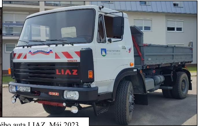
Oprava nákladného auta LIAZ. Máj 2023.