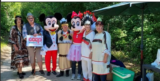
Vstup do nádherného Baňanského rozprávkového lesa. Cez 100 aktívnych hercov - amatérov pripravilo rozprávky a rôzne úlohy pre deti, aby si deti s rodičmi užili Deň detí.