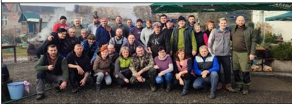
Aktívni dobrovoľníci pri spracovaní prasiatka na mäso a výrobky.

Zabíjačka v Ješkovej Vsi Tradičné zabíjačkové pochúťky sa podávali všetkým, ktorí mali záujem. Veľká vďaka patrí obetavým ľuďom, ktorí vo svojom voľnom čase obrovské prasa na rôzne chutné výrobky spracovali.