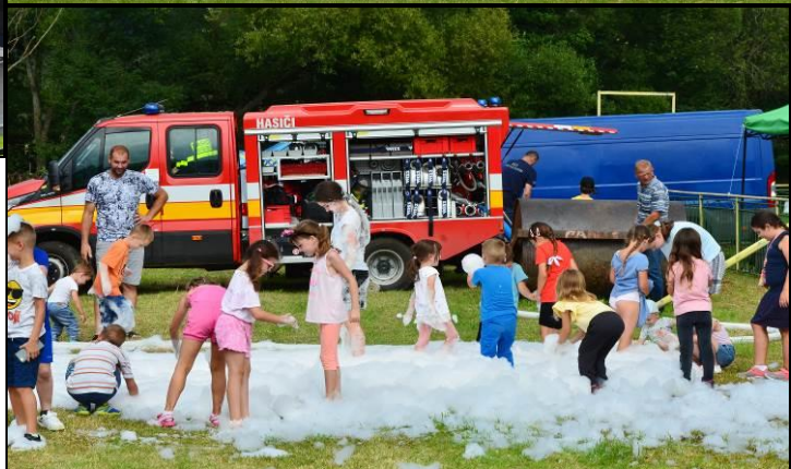
DFS Studnička, FSk Bukovec, FSk Lubená z Poluvsia, zábavka pre deti od hasičov.