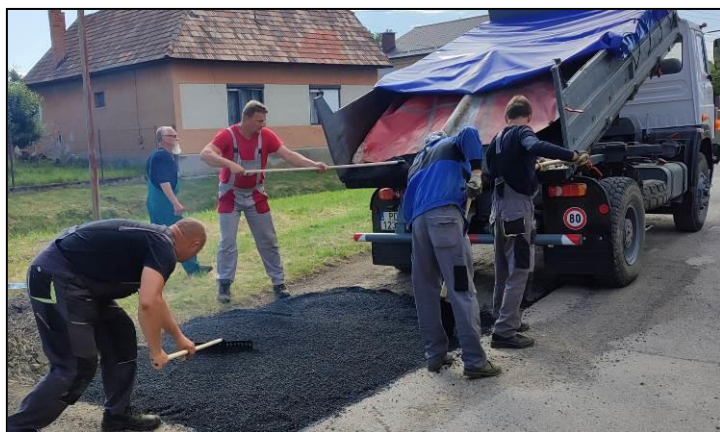
Asfaltovanie ciest svojpomocne v Ješkovej Vsi.