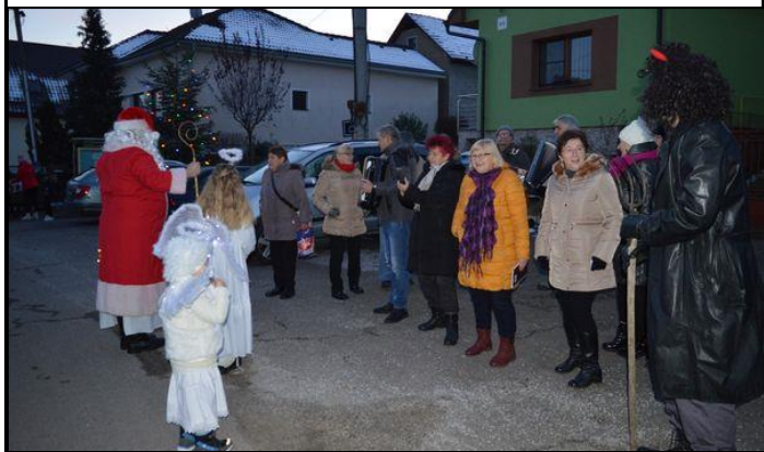
Rozsvietenie stromčeka v Somorovej Vsi.

Rozsvietenie stromčekov sa udialo prvýkrát vo všetkých častiach obce.