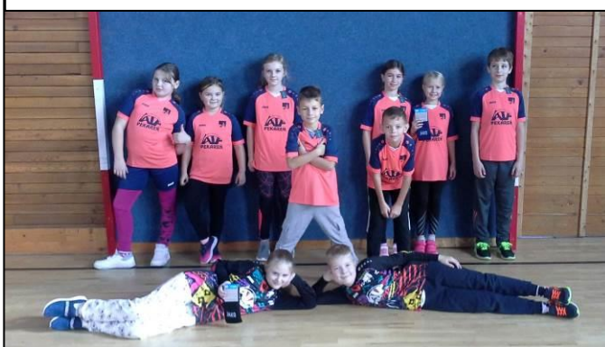
Dresy pre žiakov 1. stupňa ako sponzorský dar od Pekárne ALF Diviacka Nová Ves.

jedálni. Pult umožní žiakom prirodzený výber minimálne z dvoch druhov zeleninových šalátov. Deti získali možnosť samostatného rozhodovania pri dodržaní všetkých hygienických požiadaviek. V decembri je možné konštatovať, že očakávania sa plnia – konzumácia ovocia a zeleniny sa zlepšila. – jh-