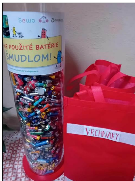
Zber bateriek do boxu a plagát o projekte Zbierame batérie so Šmudlom.