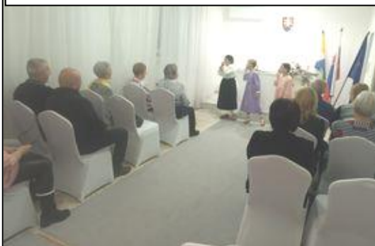
Prijatie jubilantov.

Medzi slávnosťami, ktoré tvoria členovia ZPOZ, patria víťania nových občianok obce, jubilejné sobášy, prijatie jubilujúcich členov COOP Jednoty SD Diviaky nad Nitricou, slávnosť pre darcov krvi, prijatie úspešných žiakov starostom obce, rozlúčková slávnosť deviatkov. Od 80-tych rokov v jednotlivých častiach obce realizujú spomienku na zomrelých obyvateľov našej obce Pamiatku zosnulých. V prípade požiadavky rodiny sú účastní prihovorom na poslednej rozlúčke na cirkevnom pohrebe. - gp -