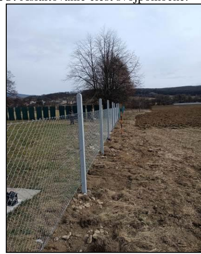
Úprava oplotenia na cintorínoch v Diviakoch nad Nitricou a v Mačove.