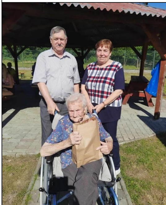
Ocenená najstaršia občianka obce Ješkova Ves so svojimi blízkymi.