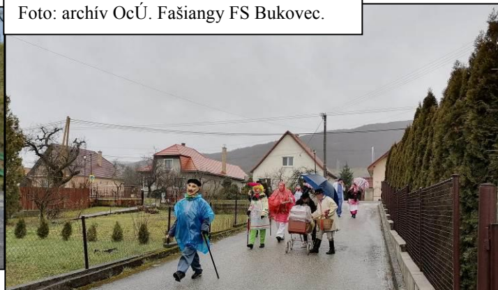
Fašiangy FS Bukovec.

Fašiangy Banky – Ješkova Ves.