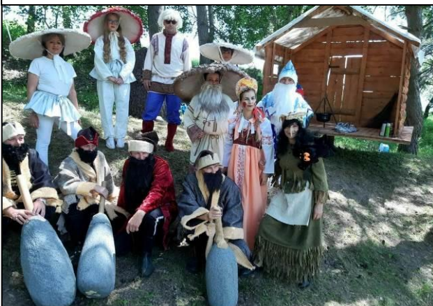
Čas pri vstupe do rozprávkového lesa sa krátil maľovaním na tvár.