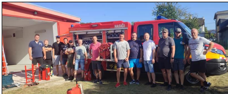
Dobrovoľný hasičský zbor Diviaky nad Nitricou.