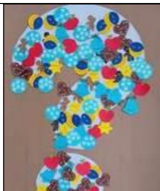
Otáznik plný životných zručností.

Piatok 8. december 2023 bol príležitosťou v predvianočnom čase predstaviť všetkým návštevníkom školy, že učiť sa dá aj pomocou rozprávok. V každej rozprávke víťazí dobro nad zlom, pretože sa pri plnení úloh vždy používa zdravý rozum a iné životné zručnosti, ktoré rozvíjame v škole.