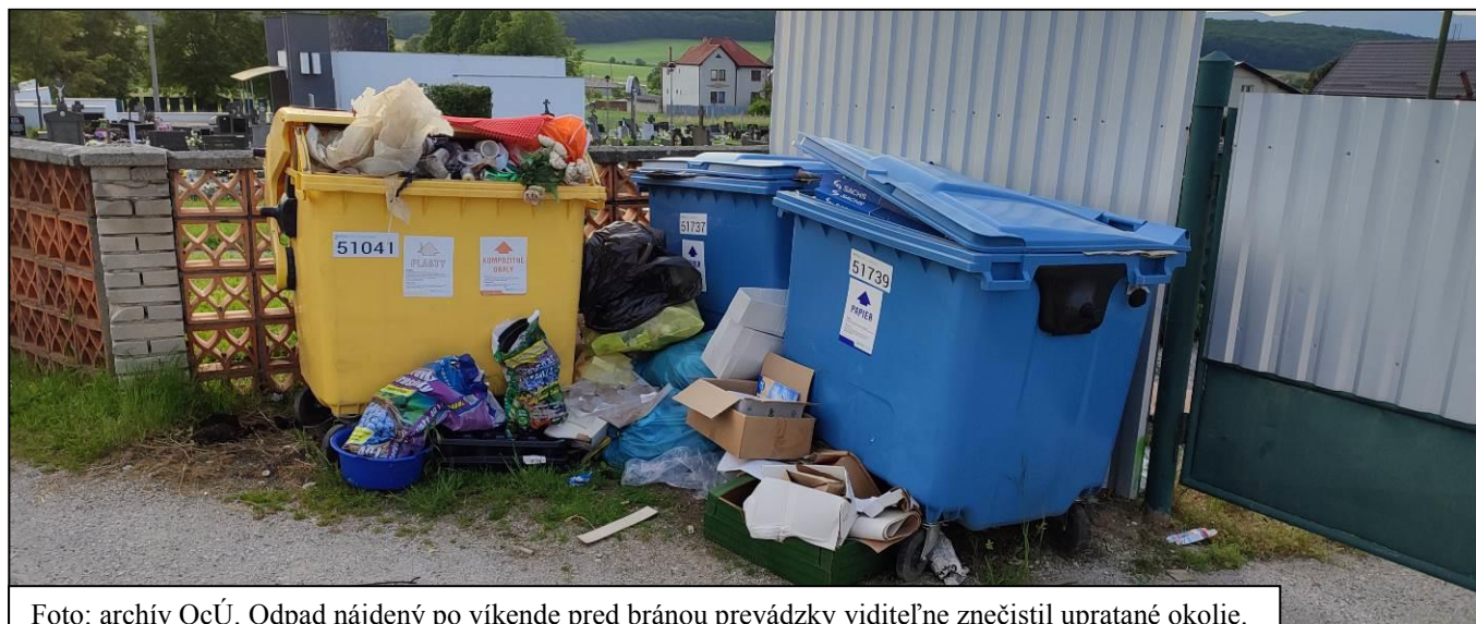
Foto: archív OcÚ. Odpad nájdený po víkend pred bránou prevádzky viditeľne znečistil upratané okolie.

Plastovými vrchnáčikmi sa stále pomáha rodine pre zdravotne oslabené dievčatko, stačí ich priviezť do školy. Plastové fľaše bez vrchnáčikov sa dajú odovzdať bez problémov v miestnej prevádzke COOP Jednoty.