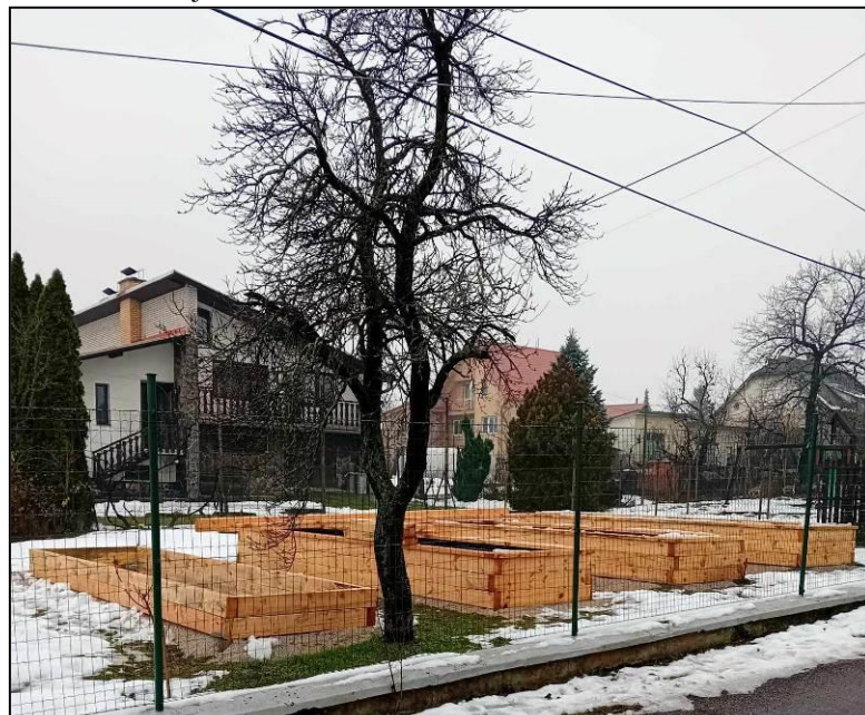
Foto: archív OcÚ. Vyvýšené záhony vybudované brigádnickou činnosťou a so zamestnancami Drobnéj prevádzky.

Komunitná záhrada vzniká na doposiaľ nevyužitej ploche pri Obecnom múzeu a Obecnej knižnici. Štyri vyvýšené záhony a ovocné stromy, kríky budú príjemným spestrením výchovno-vzdelávacieho procesu v materskej a základnej škole v spolupráci s FS k Bukovec. Projekt bol podporený v rámci grantového environmentálneho programu Zelené oči, ktorý tvorí súčasť projektu Zelená župa.