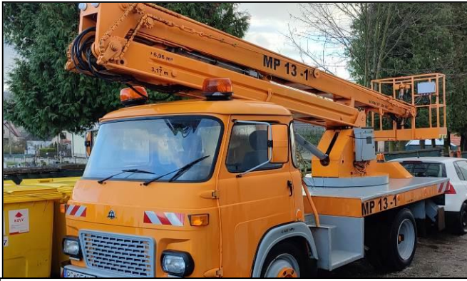
Obecná cestná plošina. Dar starostu do obce formou bezodplatného nájmu.