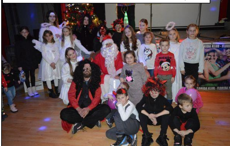
Mikuláš v Kultúrnom dome v Ješkovej Vsi.