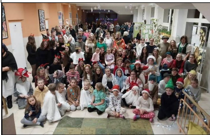
Foto: archív zš. Skupina účinkujúcich v jednotlivých rozprávkach Nočnej rozprávkovej školy.

Planéta Zem sa usmieva Myšlienku efektívneho triedenia odpadu v obci podporuje škola už mnoho rokov. Žiaci už v triedach triedia odpad do troch nádob (komunálny odpad, papier, plast). Aktuálne sa v škole triedi: papier okrem kartónov, plast, sklo, plastové vrchnáčky, batérie, mobily, drobný elektroodpad, zubné kefky, kov, kuchynský olej. Materská škola sa tiež zapojila do projektu: Zbierame použité batérie so ŠMUDLOM.