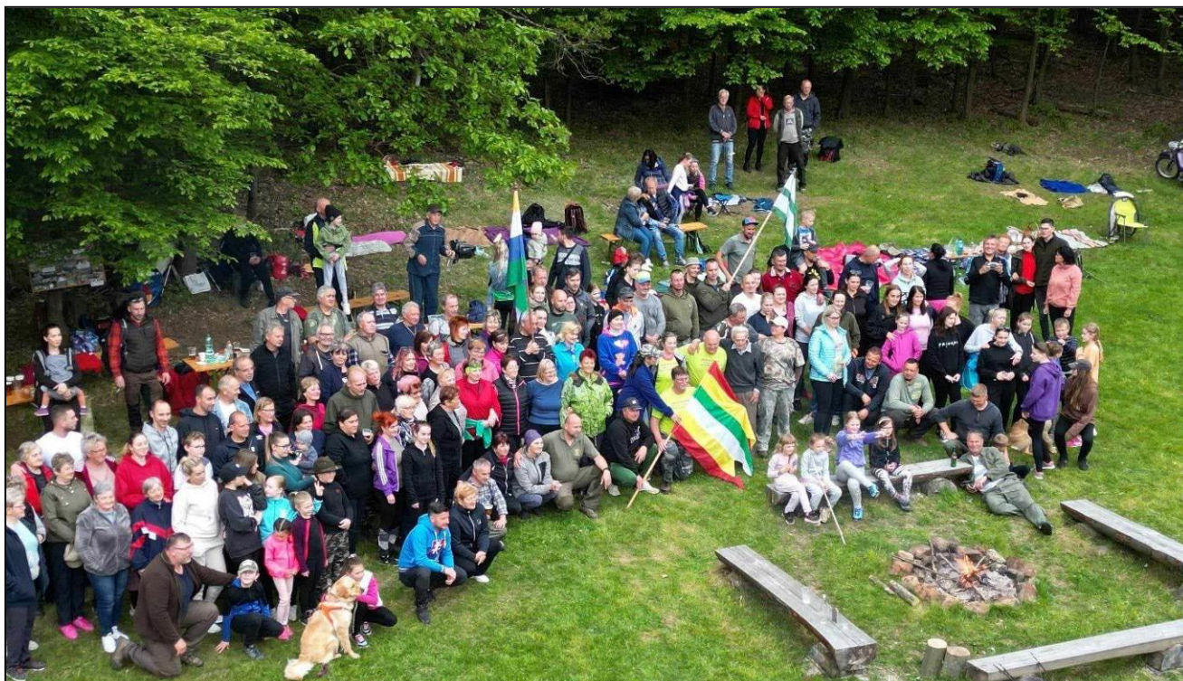
Pohľad na všetkých skvelých ľuď, ktorí podporili stretnutie medzi obcami svojou účasťou.

Stretnutie medzi obcami vyšlo na výbornú... Počasie doprialo spoločne sa stretnúť a zabaviť sa. Vďaka všetkým skvelým ľuďom, ktorí sa zúčastnili a podporili tohto roku už 5. ročník "Spoločného stretnutia medzi obcami" ďakujeme. Aj FS Bukovec patrí veľká vďaka za oživenie podujatia svojím spevom a hudbou.