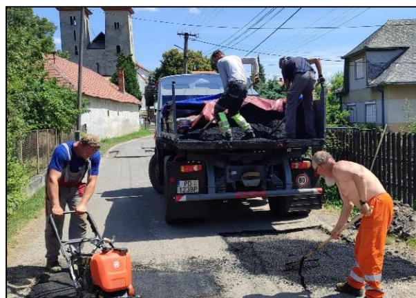
Asfaltovanie ciest svojpomocne.