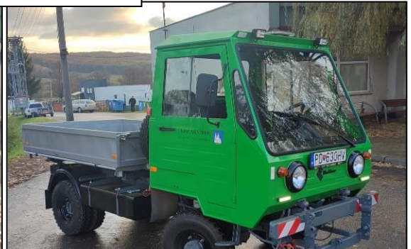
Oprava multikáry a jej využitie pri efektívnej a rýchlej údržbe ciest po snehovej nádielke.