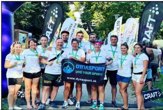
Skupina bežcov z našej obce, ktorí sa zúčastnili behu.

Štart bol v Jasnej a cieľ na Tyršovom nábreží v Bratislave. Bolo to náročné dvojdňové podujatie. Vďaka sponzorovi Dynasport Prievidza sa tohto „výživného“ behu, konajúcom sa v extrémnom teple, zúčastnilo 7 bežkyň a bežcov z našej obce. Obsadili krásne 60. miesto spomedzi 190 tímov. Ďakujeme všetkým bežkyňiam a bežcom za reprezentáciu a zviditeľnenie obce Diviaky nad Nitricou.