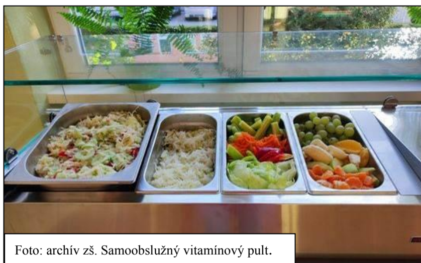
Samoobslužný vitamínový pult.

Deťom do odvozom obedov obec. Žiakom tomto školskom škoskej jedálni šalátový pult. jedálne vysvetlila súvisiace so pultom takto: žiaci si môžu alebo zeleninový nabráť, skonzu-docielime konzumnožstva zeleniny