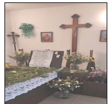
Pamiatka zosnulých v DS Banky.

Medzi slávnosťami, ktoré tvoria členovia ZPOZ, patria víťania nových občianok obce, jubilejné sobášy, prijatie jubilujúcich členov COOP Jednoty SD Diviaky nad Nitricou, slávnosť pre darcov krvi, prijatie úspešných žiakov starostom obce, rozlúčková slávnosť deviatkov. Od 80-tych rokov v jednotlivých častiach obce realizujú spomienku na zomrelých obyvateľov našej obce Pamiatku zosnulých. V prípade požiadavky rodiny sú účastní prihovorom na poslednej rozlúčke na cirkevnom pohrebe. - gp -