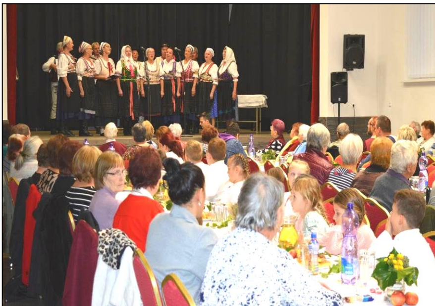
Bukovec rozveselil seniorov a motivoval k spievaniu.