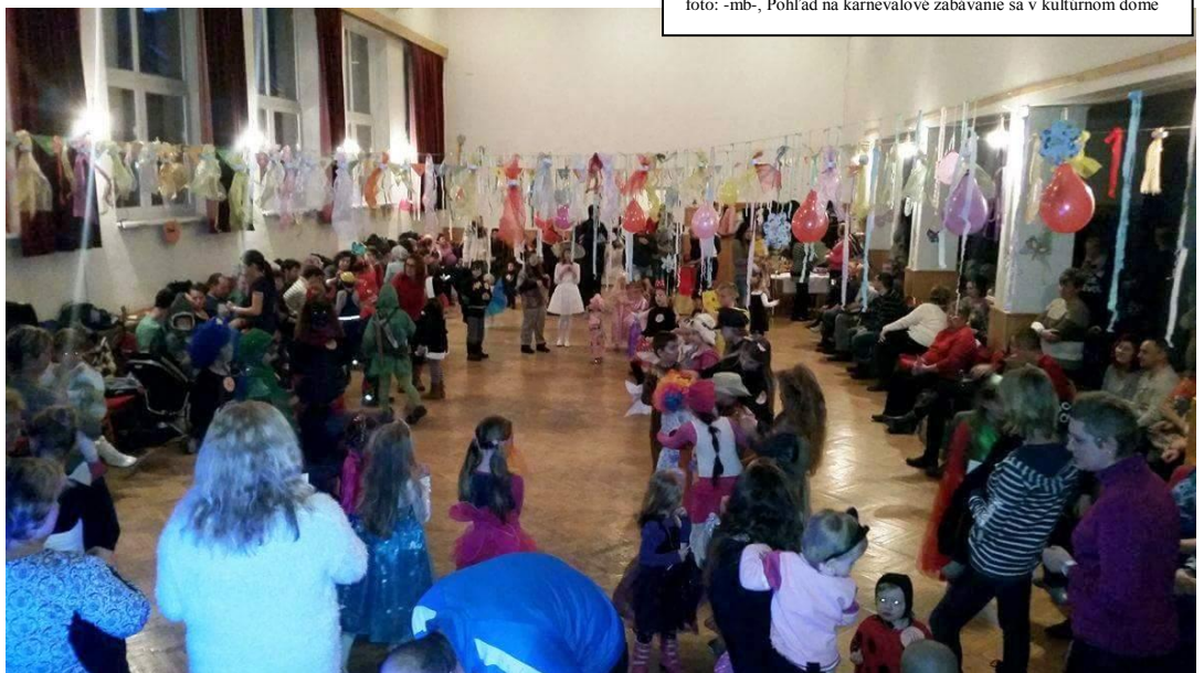
Pohľad na karnevalové zabávanie sa v kultúrnom dome

Predstavilo sa množstvo masiek, rozprávkových bytostí ale i iných – filmových – postáv. Pri dobrej hudbe sa deti vyšantili, zabavili a zatancovali preoblecení do svojho sna, byť aspoň malú chvíľu vysnívanou bytosťou. V troch kategóriách (0 až 2,9 rokov, 3 až 5,9 roka, 6 rokov a viac) bolo za pomoci komisie zostavenej z prítomných rodičov a rodinných príslušníkov ocenených 3 krát 10 masiek. Aj ostatné masky dostali darček. ĎAKUJEME všetkým sponzorom a organizátorom, ktorí poskytli odmeny do balíčkov, ceny pre výherné masky a tak pomohli pri uskutočnení tejto veľkolepej akcie. Výtazok z akcie sme odovzdali pani učiteľkám materskej školy na zakúpenie hračiek. -mb-