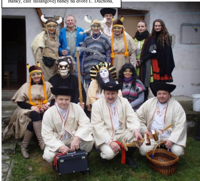
Banky, časť fašiangovej bandy na dvore L. Duchoňa,

V našej obci sa stalo už tradíciou, že posledný víkend pred Popolcovou stredou, ktorou začína 40-denný pôst, patrí fašiangovníkom. Fašiangy v Ješkovej Vsi a v Bankách organizačne zabezpečuje KST Ješkova Ves – Banky s ďalšími spoločenstvami. Už pár rokov sú zamerané na nejakú tému. Tento rok to boli „rohaté“ fašiangy.