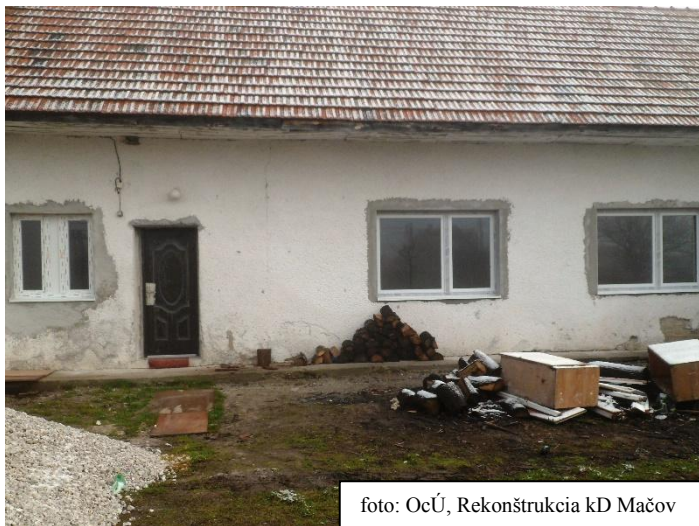
Rekonštrukcia kD Mačov