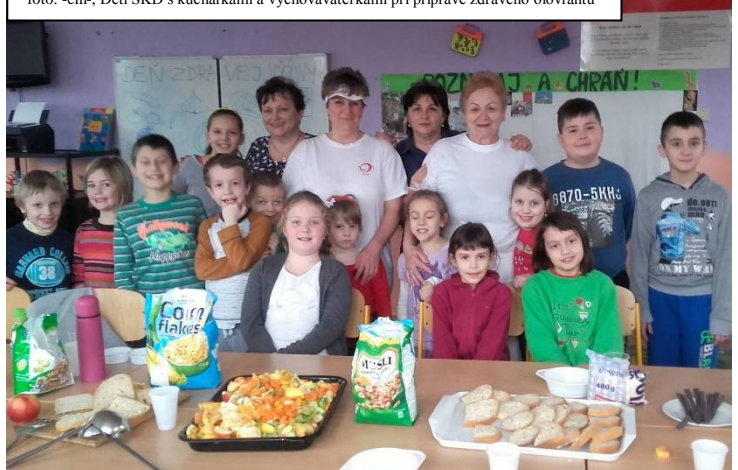
Deti ŠKD s kuchárkami a vychovávateľkami pri príprave zdravého olovrantu

čo si pripraví každý sám, chutí najlepšie.