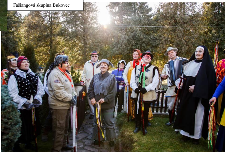
Fašiangová skupina Bukovec

V častiach obce Mačov, Somorova Ves a Diviaky fašiangovala FSk Bukovec. Piatok poobede si vyhradili pre Mačov, kde do tradície chtivých domácnosti priniesli krásne a veselé zvyky patriace k fašiangom.