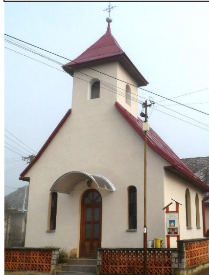
Prístrešok na Kaplnke v Mačove

a hlavne financií zvládnuť. Spomeniem aspoň tie najdôležitejšie pre nasledovné obdobie: výmena autobusových zastávok v časti obce Ješkova Ves a Diviaky, osvetlenie priechodov pre chodcov, osvetlenie cintorínov, prestrešenie Domu smútku Diviaky. A na záver si želim neustálu spoluprácu s vami - občanmi, čakám a vážim si dobré a povzbudzujúce rady, ale aj pripomienky, vážim si vašu ochotu a toleranciu. Ďakujem všetkým, ktorým osud našej obce nie je ľahostajný. Pozývam vás na najbližšie zasadnutie obecného zastupiteľstva, ktoré je plánované 14. marca 2016 o 17:00 h v KD Diviaky nad Nitricou.