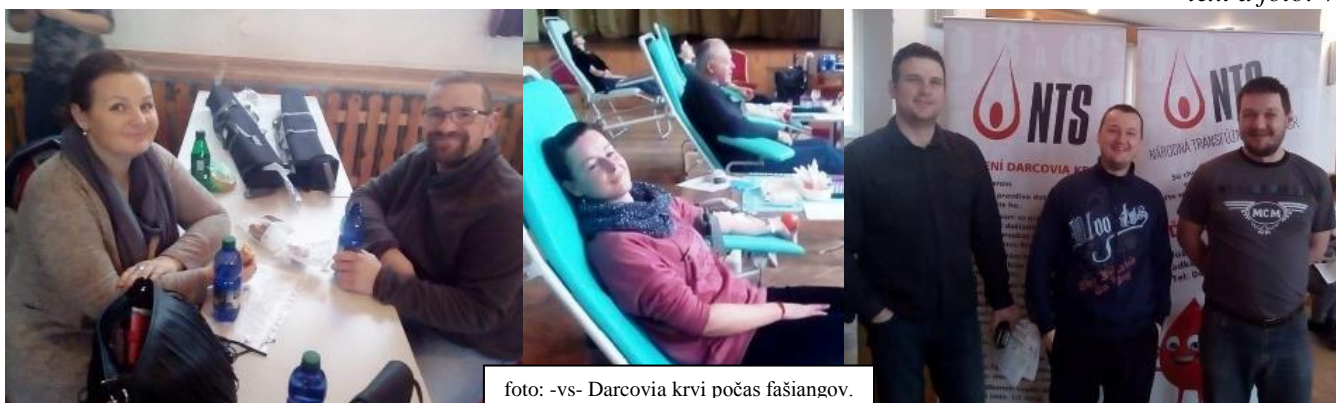
Darcovia krvi počas fašiangov.