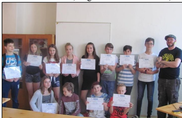
Anglický lektor (vpravo) so skupinou žiakov počas jazykového týždňa.