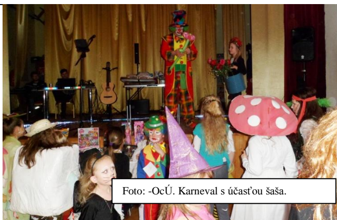
Karneval s účasťou šaša.