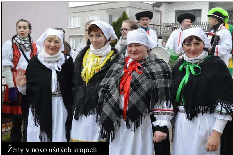
Ženy v novo ušitých krojoch.

Fašiangy 2018 v Ješkovej Vsi a v Bankách Každý rok rozmýšľame, akú novú tému na fašiangy zvolíť, aby fašiangy boli pestré a aspoň trochu iné. Preto sme si vybrali – Zelené fašiangy .