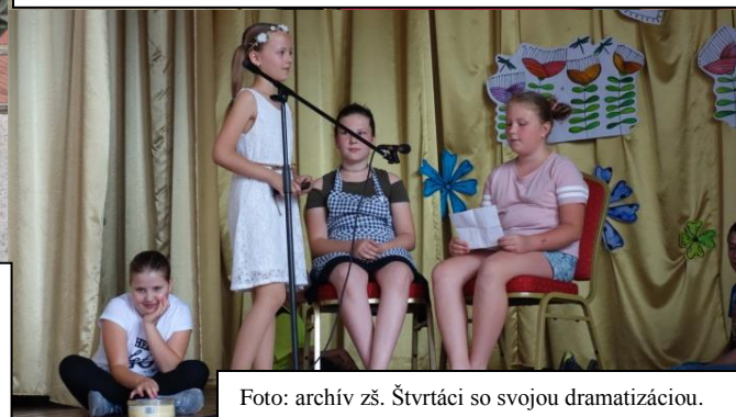
Štvrtáci so svojou dramtizáciou.