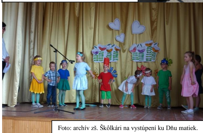
Škôlkári na vystúpení ku Dňu matiek.