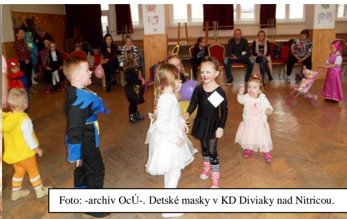
Detské masky v KD Diviaky nad Nitricou.