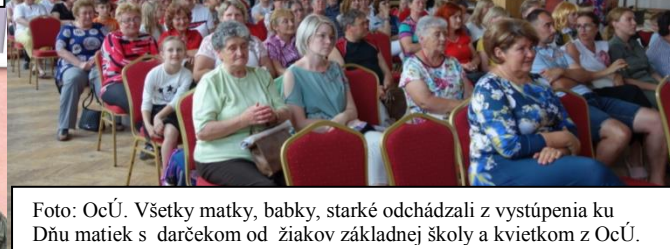
Všetky matky, babky, starké odchádzali z vystúpenia ku Dňu matiek s darčekom od žiakov základnej školy a kvietkom z OcÚ.