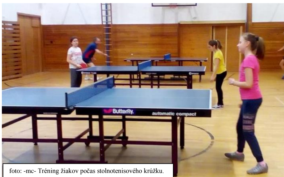
Tréning žiakov počas stolnotenisového krúžku.

„Pokladám si za povinnosť venovať sa žiakom a tým, že im vytvorím dobré podmienky na šport, tým dávam šancu zaradiť sa do kolektívu, v ktorom budú nielen utužovať kolektív, ale aj súťažiť v rámci regiónu a kraja o tie najlepšie výsledky.“