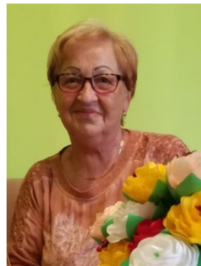
-text: gp-