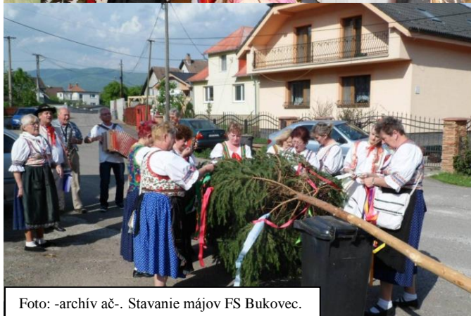
Stavanie májov FS Bukovec.