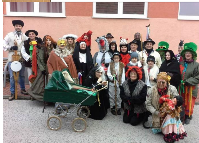
Folklórna skupina Bukovec počas fašiangovania si viditeľne zvýšila počet členov. V krásnych maskách potešili spevom a tancom obyvateľov Mačova, Somorovej Vsi a Diviak nad Nitricou.