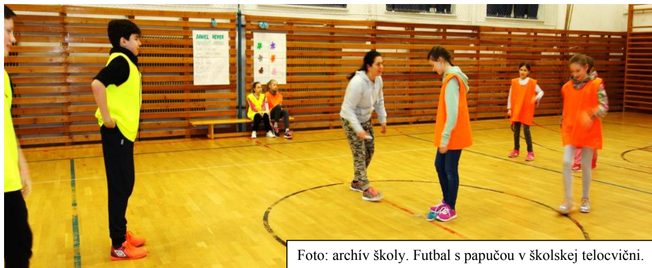
Futbal s papučou v školskej telocvični.