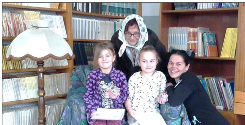
Prváčky pasované za čitateľky knižnice.