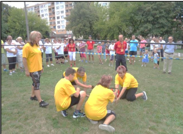
Hribári pri triafaní kameňa prakom do plechového vedra.

Počas všetkých rokov sa pripájali ďalšie dediny zblízka aj zďaleka. Osem rokov bolo skúškou našej tvorivosti, nápadov, organizátorských schopností, chuti obetovať množstvo voľného času veľkého množstva zapojených ľudí. Túto tradíciu sme posunuli do Necpal, mestskej časti Prievidze, kolektívu úžasných ľudí, závideniahodných dobrých suse-