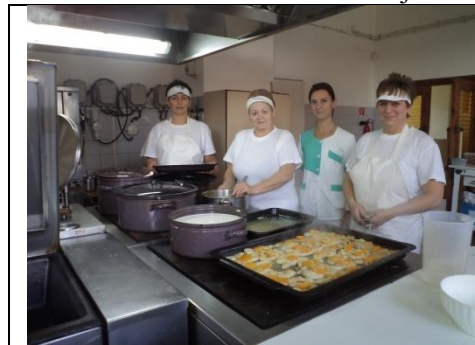
Kuchárky v školskej kuchyni pripravujú denne približne 220 porcií.

Počiatočné drobné nedostatky týkajúce sa harmonogramu, spôsobu dovozu a odvozu obedov, zabezpečenia dvoch kusov vlastných obedárov, ktoré sa neporušia pri ceste autom a podobne, boli veľmi rýchlo odstránené. Cudzí stravníci, ktorí si stravu odnášajú samostatne, majú obedár prichystaný na polici vo vestibule školskej jedálne. Zároveň prinášajú prázdne obedáre na nasledujúci deň. Strava podávaná v školskej jedálni je jednotná pre všetky kategórie stravníkov. Jedálny lístok je vyvesený na nástenke a vo vestibule školskej jedálne a na webe školy. Strava do obedárov sa naberá v čase medzi dvojfázovým výdajom obedov pre mladších žiakov a starších žiakov školy.