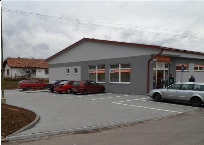
Pri miestnej COOP Jednota Supermarket vzniklo 6 nových parkovacích miest. Realizátorom akcie bola COOP Jednota Prievidza, ktorá celú akciu financovala.

Najväčšiu a najdôležitejšiu zmenu prináša nový zákon v triedenom zbere. Zodpovednosť za financovanie triedeného zberu prejde od roku 2016 na výrobcov a dovozcov, ktorých budú zastupovať OZV (organizácie zodpovedností výrobcov). Zákon o odpadoch môže priniesť obciam a mestám viac peňazí. Ak sa bude obec zodpovedne venovať separácii, triedeniu odpadov (plasty, sklo, kovy, papier,...), tak zníži množstvo komunálneho odpadu. Za vytriedený odpad obec získa finančné prostriedky od OZV. V súvislosti so zmenou zákona sa pripravujú niektoré zmeny vo VZN - poplatok za drobný stavebný odpad, poplatok za komunálny odpad. Podrobnejšie informácie budú zverejnené vo VZN obce v mesiaci december. -ik-