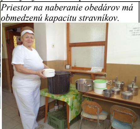
Priestor na naberanie obedárov má obmedzenú kapacitu stravníkov.