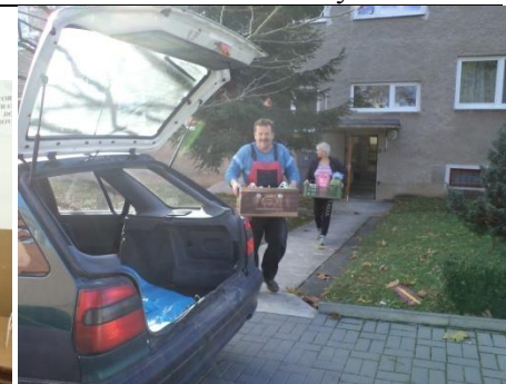
Dovoz stravy zabezpečujú pracovníci obce, drobnej prevádzky.