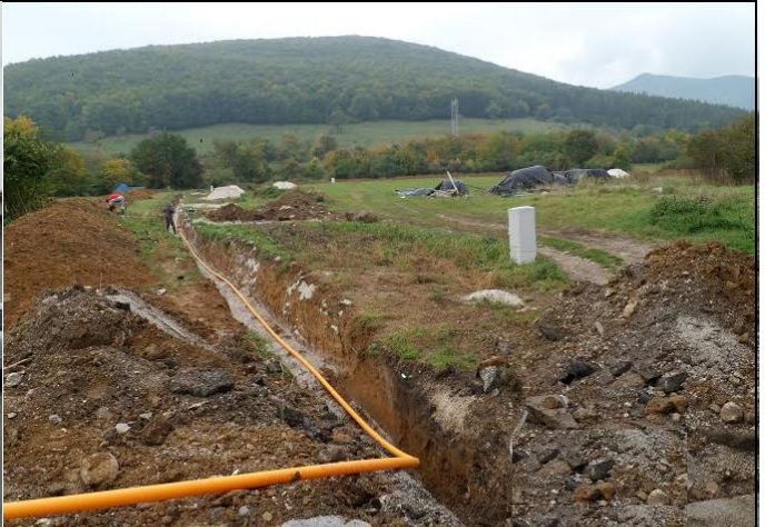
Inžinierske siete IBV Kalinovska - položenie rozvodov plynu a vody. Náklady boli financované z obecného rozpočtu a pôžičkou obce z biskupského úradu v Nitre.