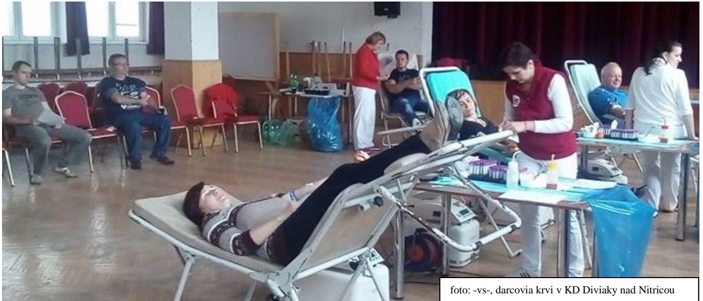
darcovia krvi v KD Diviaky nad Nitricou