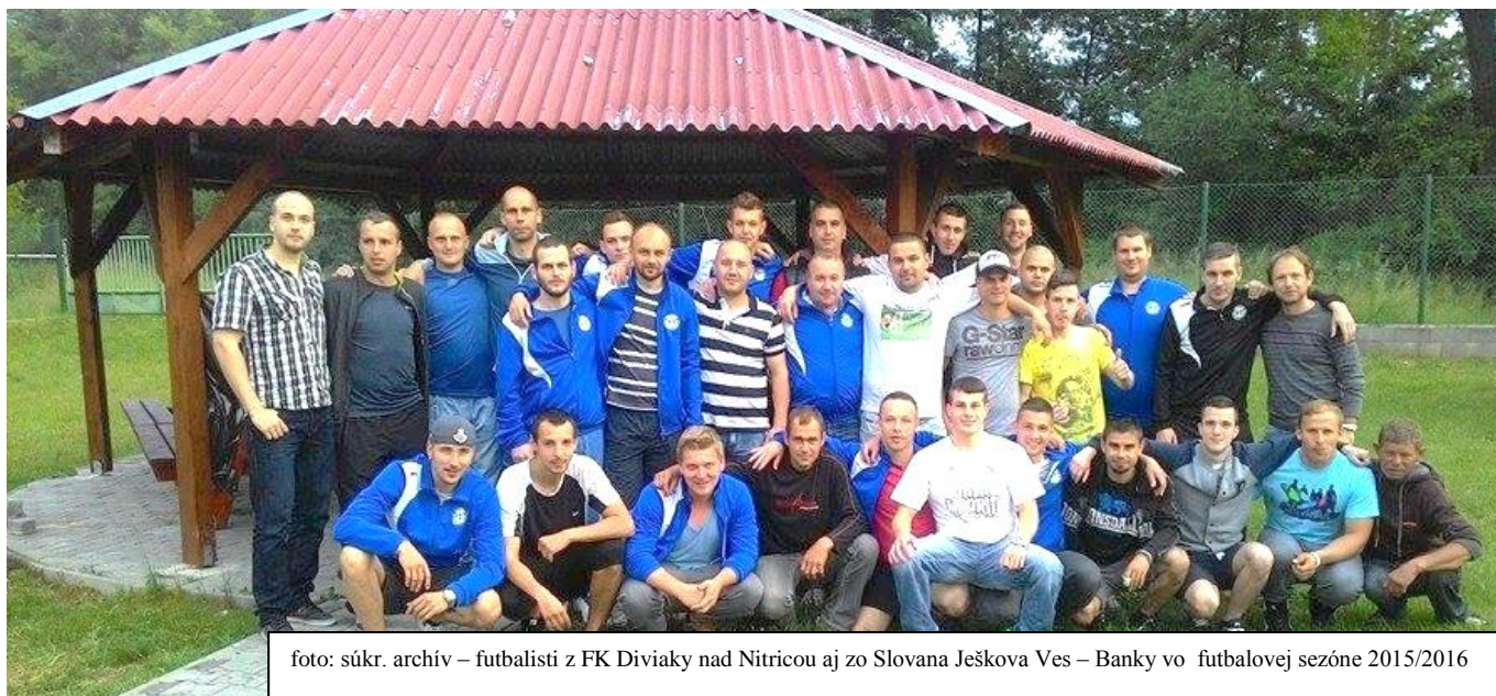
futbalisti z FK Diviaky nad Nitricou aj zo Slovana Ješkova Ves – Banky vo futbalovej sezóne 2015/2016