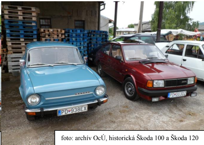
historická Škoda 100 a Škoda 120