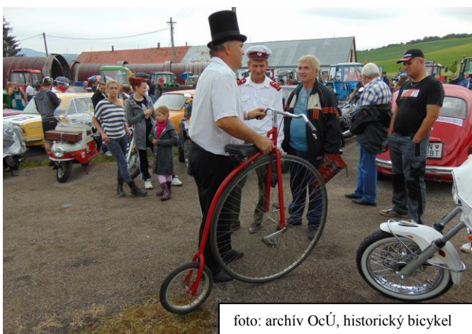
historický bicykel