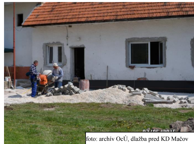
dlažba pred KD Mačov