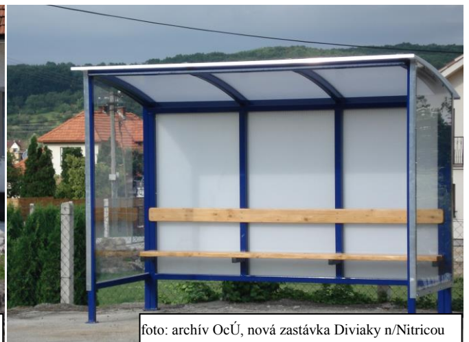
nová zastávka Diviacky n/Nitricou